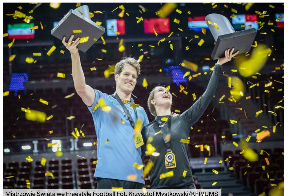
Mistrzowie Świata we Freestyle Football

dzięki oficjalnym kanałom światowej federacji WFFA, przekaz o wydarzeniu w Sopocie trafił do dodatkowych ponad 1,9 mln odbiorców . Istotnym elementem były warsztaty, w których wzięło udział 1 200 dzieci.