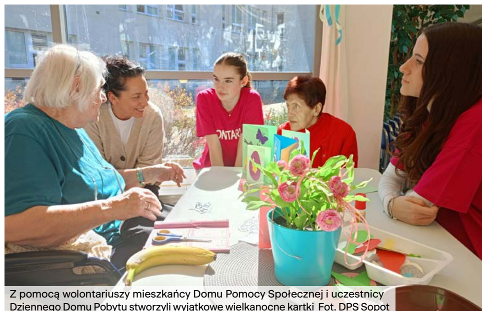
Z pomocą wolontariuszy mieszkańcy Domu Pomocy Społecznej i uczestnicy Dziennego Domu Pobytu stworzyli wyjątkowe wielkanocne kartki.

Ważnymi punktami na mapie wsparcia są placówki stacjonarne. Dzienny Dom Pobytu ( 34 uczestników) oferuje seniorom terapię, zajęcia rekreacyjne i posiłki,