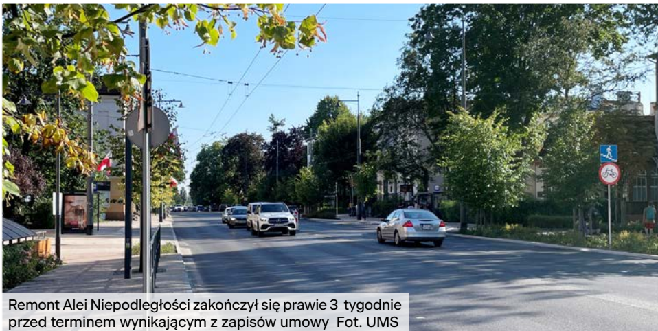
Remont Alei Niepodległości zakończył się prawie 3 tygodnie przed terminem wynikającym z zapisów umowy