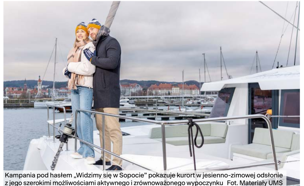
Kampania pod hasłem „Widzimy się w Sopocie” pokazuje kurort w jesienno-zimowej odsłonie z jego szerokimi możliwościami aktywnego i zrównoważonego wypoczynku

cieszyły się zniżki na zakup biletu wstępu na Molo, na zakup pamiątek w punktach informacji turystycznej oraz oferta lokali gastronomicznych.