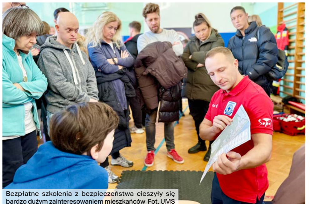
Bezpłatne szkolenia z bezpieczeństwa cieszyły się bardzo dużym zainteresowaniem mieszkańców

Komenda Miejska Państwowej Straży Pożarnej otrzymała dofinansowanie w wysokości 283 996 tys. zł . Środki przeznaczone na pokrycie wydatków bieżących oraz na zakup samochodu specjalnego do przewozu osób MB V250. Wsparcie z budżetu miasta otrzymała również Ochotnicza Straż Pożarna i Morski Oddział Straży Granicznej – odpowiednio 58 104 zł i 16 tys. zł .