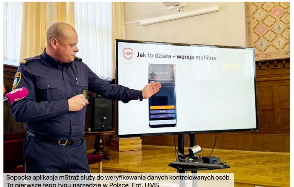
Sopocka aplikacja mStraż służy do weryfikowania danych kontrolowanych osób. To pierwsze tego typu narzędzie w Polsce.

Miasto za ten projekt zdobyło prestiżową nagrodę Smart City Awards w kategorii „Smart City od 30 tys. do 100 tys. mieszkańców”.