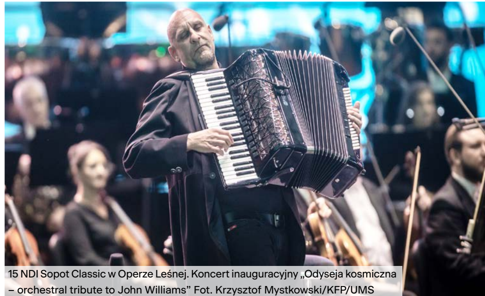
15 NDI Sopot Classic w Operze Leśnej. Koncert inauguracyjny „Odyseja kosmiczna – orchestral tribute to John Williams”

koncertowej PFK, na scenie głównej Opery Leśnej, scenie LASY, a także w Mamuszki 14.