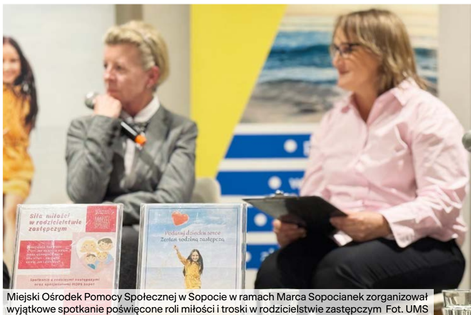
Miejski Ośrodek Pomocy Społecznej w Sopocie w ramach Marca Sopocianek zorganizował wyjątkowe spotkanie poświęcone roli miłości i troski w rodzicielstwie zastępczym.