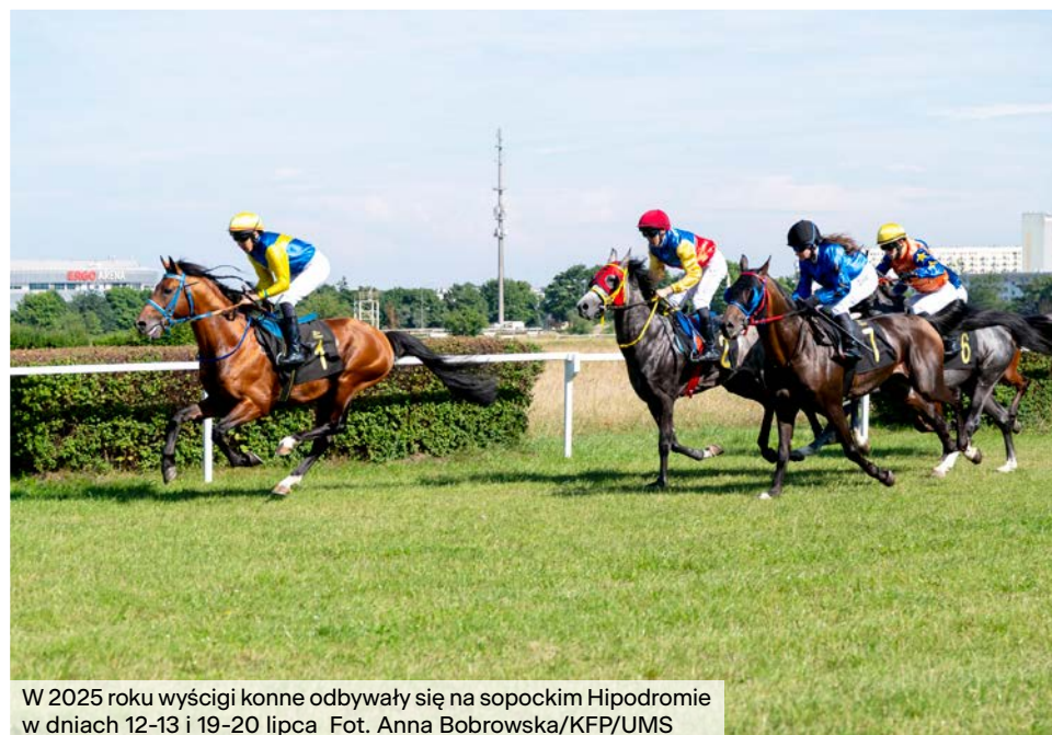
W 2025 roku wyścigi konne odbywały się na sopockim Hipodromie w dniach 12-13 i 19-20 lipca.

dla dzieci i młodzieży w wieku 5-16 lat. Jest organizatorem turniejów, imprez