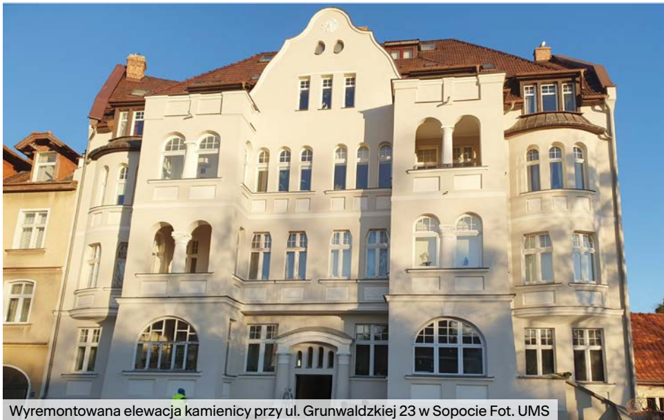
Wyremontowana elewacja kamienicy przy ul. Grunwaldzkiej 23 w Sopocie

W 2023 pojawiła się możliwość uzyskania dotacji z Rządowego Programu Odbudowy Zabytków. Miasto uzyskało dofinansowanie z tego programu dla remontu kaplicy w parafii rzymskokatolickiej pw. św. Andrzeja Boboli w wysokości 2 939 700 zł . Kaplica pw. Wniebowzięcia NPM zbudowana została w latach 1896-1870 jako pierwsza świątynia katolicka w Sopocie. Obiekt wpisany jest do rejestru zabytków. Remont rozpoczęty w roku 2024 obejmował prace ogólnobudowlane, konserwatorskie, sanitarne, elektryczne i teletechniczne. Zakończenie remontu nastąpiło w październiku 2025 r.