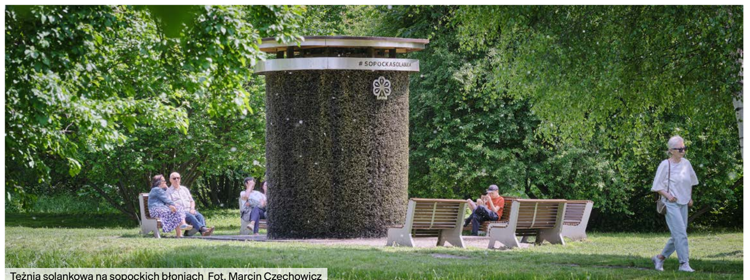
Tężnia solankowa na sopockich błoniach

Magdalena Gazyńska-Jachim Prezydentka Sopotu