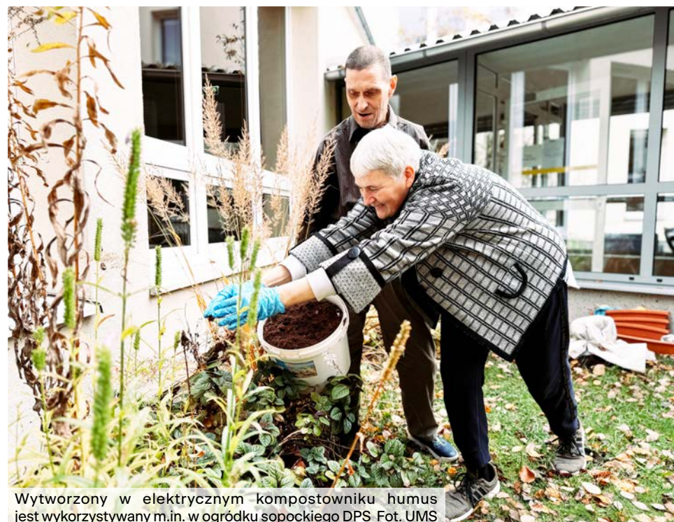
Wytworzony w elektrycznym kompostowniku humus jest wykorzystywany m.in. w ogródku sopockiego DPS.

31 stycznia 2025 r. spółka ECO Sopot rozpoczęła dystrybucję bezpłatnych worków na odzież i tekstylia . Worki są odbierane od mieszkańców raz w miesiącu, razem z „wystawkami”, zgodnie z harmonogramem. Można je również oddawać bezpośrednio w PSZOK przy Al. Niepodległości.