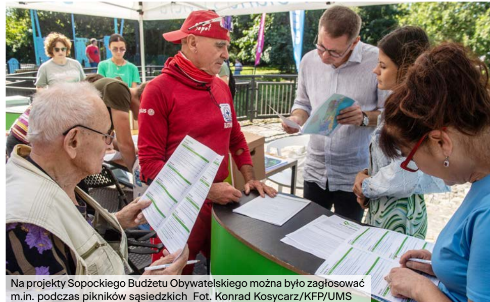
Na projekty Sopockiego Budżetu Obywatelskiego można było zagłosować m.in. podczas pikników sąsiedzkich.

W roku 2025 obowiązywał pierwszy raz nowy regulamin Sopockiego Budżetu Obywatelskiego , dzięki czemu mieszkańcy mieli jeszcze większy wpływ na to jak wygląda ich miasto. Jedną ze zmian jest podział miasta na 8 okręgów , w oparciu o mapę obwodów wyborczych. Kwota, która otrzymali do dyspozycji mieszkańcy każdego okręgu była uzależniona od liczby zameldowanych osób. Mieszkańcy okręgu, w którym była najwyższa frekwencja, otrzymali dodatkowo 100 tys. zł na realizację projektów. Wprowadzenie tych zmian spowodowało wyższą frekwencję głosujących.