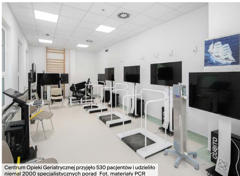
Centrum Opieki Geriatrycznej przyjęło 530 pacjentów i udzieliło niemal 2000 specjalistycznych porad.

W okresie wakacyjnym wzmocnione zostały zespoły ratownictwa medycznego. Od 1 czerwca do 31 sierpnia codziennie, przez 12 godzin (od 7.00 do 19.00), w Sopocie działał dwuosobowy zespół Podstawowego Ratownictwa Medycznego „P”.