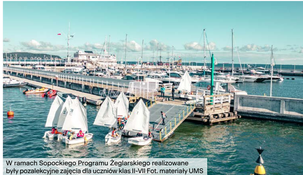
W ramach Sopockiego Programu Żeglarskiego realizowane były pozalekcyjne zajęcia dla uczniów klas II-VII

obowiązkowych i pozalekcyjnych. Dzieci i młodzież mają możliwość podnoszenia