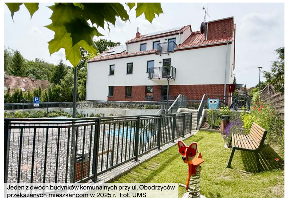
Jeden z dwóch budynków komunalnych przy ul. Obodrzyców przekazanych mieszkańcom w 2025 r.

Z tw. starego zasobu komunalnego w 2025 r. zasiedlono 45 lokali , w tym 27 lokali mieszkalnych, 2 lokale z listy wymian, 2 dla rodzin repatriantów oraz 14 lokali w ramach najmu socjalnego (w tym 1 dla wychowanka pieczy zastępczej i 3 dla osób pozostających w kryzysie bezdomności).